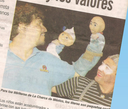
Para los títeres de La Charca de México, los títeres son pequeños confi

Los títeres, prosiguió, tienen gran importancia en la parte lúdica, formativa y pedagógica, pues todos de alguna u otra manera fuimos títeres cuando éramos niños al jugar con nuestros juguetes.